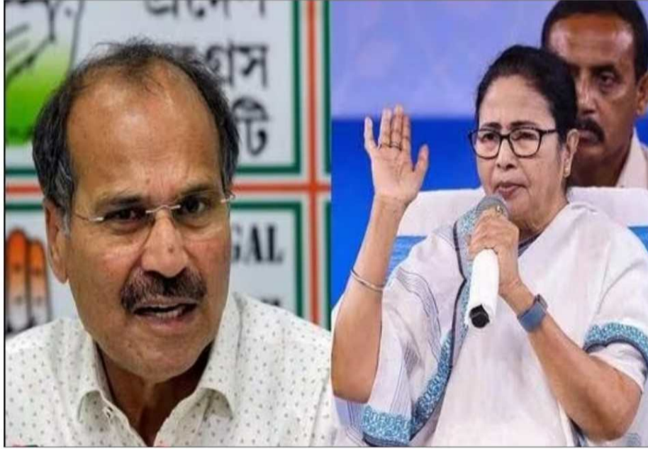
আলোচনা না করেই রাজ্যের করে দেন। ফলে, অঙ্কুরেই যদিও পাঞ্জাব ও দিল্লিতে ৪২টি আসনের প্রার্থী ঘোষণা জোট সম্ভাবনা জলে যায়। এরপর ৩ পাতায়

জোটকে বাইরে থেকে সমর্থন করবে তৃণমূল। এরই জবাবে অধীর বলেন, তিনি মমতাকে বিশ্বাস করেন না। উনি বাংলায় জোট ভেঙে দিয়েছেন। শুধু তাই নয়, তৃণমূল নেত্রীর বিরুদ্ধে বিক্ষোভ অভিযোগ তুলে প্রদেশ কংগ্রেস সভাপতি বলেন, পশ্চিমবঙ্গের মুখ্যমন্ত্রী ইতিমধ্যেই এনডিএ-কে সমর্থনের লাইনে দাঁড়িয়ে গিয়েছেন। আগামী সোমবার, ২০ মে লোকসভার পঞ্চম দফার ভোটের ঠিক মুখে ইন্ডিয়া জোটের ভবিষ্যৎ নিয়ে প্রশ্নিচ্ছি উঠে যাওয়ায় ফাটল যেন দীর্ঘতর হচ্ছে। তবে অধীর এও বলেন যে, মমতার এই কথাতেই প্রমাণ হয় যে, কংগ্রেস এবং ইন্ডিয়া জোটই ক্ষমতায় আসছে। সংবাদ সংস্থাকে এক সাক্ষাৎকারে অধীর বলেন, বিজেপির একমাত্র লক্ষ্য কংগ্রেসকে ধ্বংস করা। ওরা বলে বেড়াচ্ছে কংগ্রেস ৪০টির বেশি আসনে জিততে পারবেনা। কিন্তু, মমতার কথায় একটা বিষয় পরিষ্কার যে, কংগ্রেস নেতৃত্বাধীন ইন্ডিয়া জোটই ক্ষমতায় আসছে। ইন্ডিয়া জোট গঠনের সময় প্রথম থেকেই আম আদমি পার্টির নেতা দিল্লির মুখ্যমন্ত্রী অরবিন্দ কেজরিওয়াল এবং বাংলার মুখ্যমন্ত্রী মমতা বন্দ্যোপাধ্যায় আসন বন্টনের বিষয়ে আলোচনা চাইছিলেন। কিন্তু, দীর্ঘ অপেক্ষার পর কংগ্রেস ও বামদের সঙ্গে